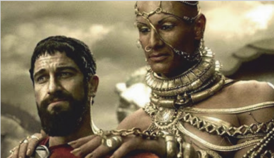
Afb. 1 Xerxes en Leonidas in de film 300 (Warner 2007).

Van alle Perzische koningen kwam Xerxes op de meest dramatische wijze met de Griekse wereld in conflict en het is Herodotus die van dat conflict de meest invloedrijke literaire verbeelding biedt. Mede door de Europese schooltraditie is dat beeld tot de dag van vandaag vertrouwd. Dit wil zeggen dat lang vóór assyriologen de opstand in Babylonië op het spoor kwamen in kleitabletten (vanaf de eerste helft van de 20 e eeuw), er al een idee bestond over wat voor koning Xerxes was.