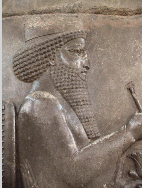
Afb. 3 Darius, afgebeeld op een reliëf-plaat in het paleis van Persepolis.

“verhalen” en gebeurtenissen, die klassieke auteurs volledig of ten dele onbekend waren. Deze ontdekkingen nodigen ons uit de politieke, sociale en culturele geschiedenis van het Perzische Rijk opnieuw te schrijven en een betere balans te vinden tussen externe en interne gezichtspunten. Daar waar de postkoloniale wending van de jaren '80 uitging van oudhistorici met een veelal klassieke opleiding, is de opwaardering van de lokale corpora als bron voor de Perzische geschiedenis een reactie uit (of misschien beter, een voortzetting door) de archeologie en een aantal vakgebieden met een traditioneel filologisch karakter, zoals de semitistiek, de papyrologie, de iranistiek, de assyriologie en de egyptologie.