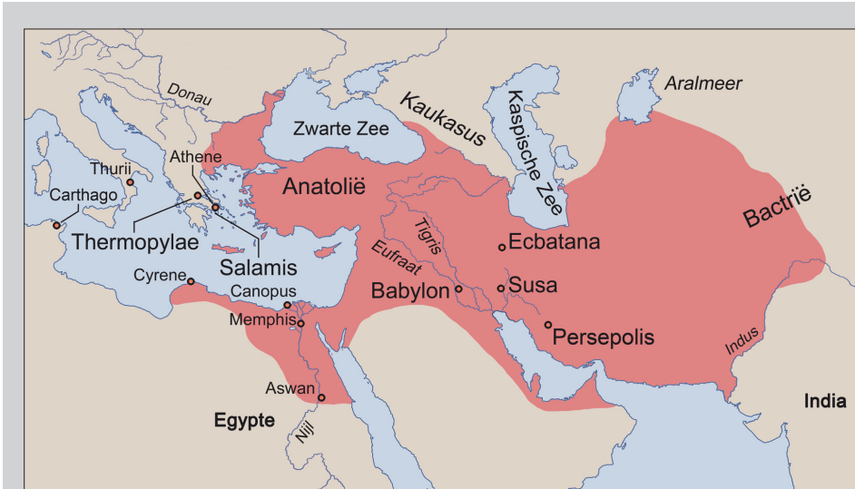
Afb. 2 Het Perzische Rijk tijdens de regering van Xerxes I.

Ook moet men zich realiseren dat Herodotus eeuwenlang gold als voornaamste bron over het Perzische Rijk, samen met andere klassieke schoolauteurs zoals Xenophon en Plato. De autoriteit van de Griekse auteurs was vanzelfsprekend en natuurlijk. Het was normaal om naar de Perzen te kijken door de ogen van omstaanders. Het was evident hen te beschrijven met de woorden van auteurs die in de marge van dit machtige rijk leefden, in vrees of bewondering ervoor, óf zelfs vele eeuwen later vanuit een eigen culturele en literaire beleving.